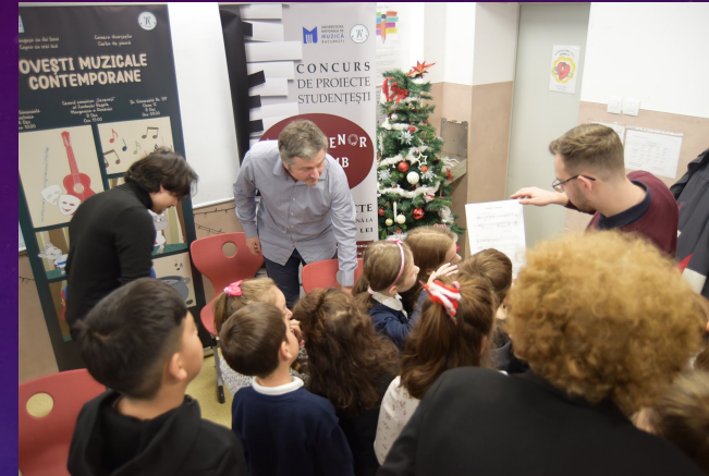
Punguța cu doi bani Capra cu trei iezi

8 decembrie – Centrul Comunitar Generații al Fundației Regale Margareta a României.