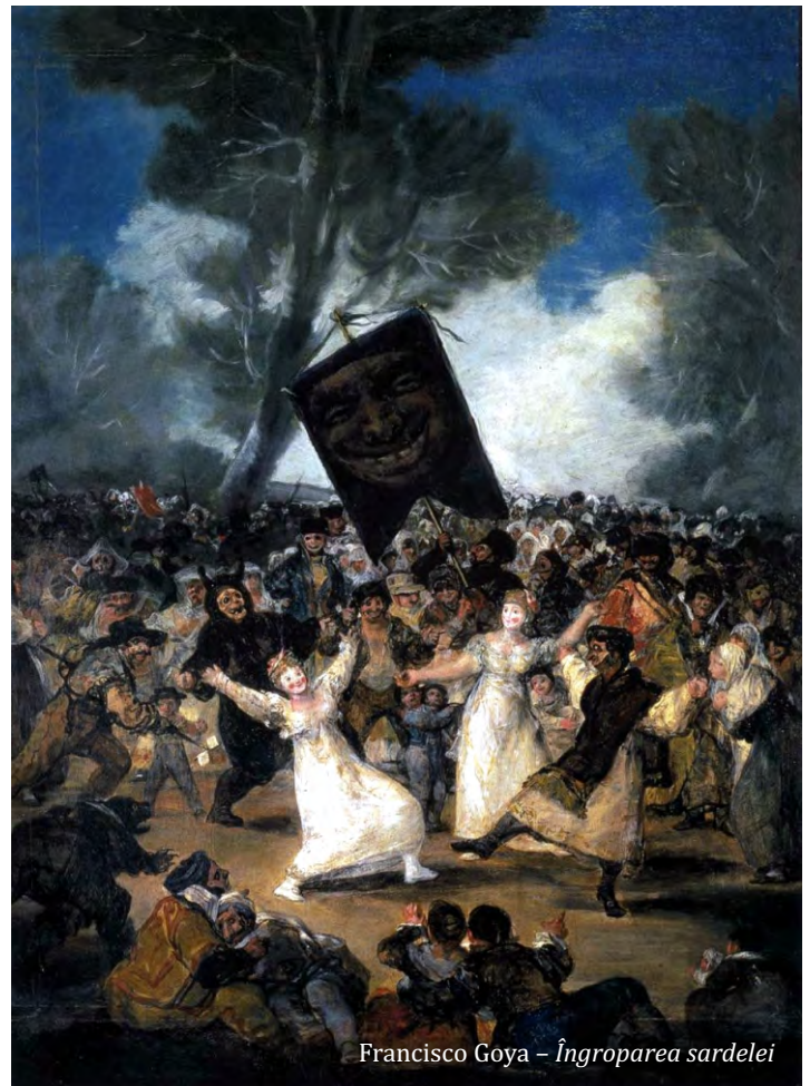
Francisco Goya – Îngroparea sardelei

Mai mult, jubileul a devenit un sport la modă și o manieră de a câștiga capital de imagine prin parazitarea celor mai felurite ocazii: evenimente istorice și religioase, aniversări, comemorări, înmormântări celebre, apariții editoriale, concerte-eveniment, show-uri cu premii etc. Avem sau nu vreo legătură cu jubileul, intrăm în joc și ne facem treaba de pioși soldați în armata laudătorilor. A devenit un joc de societate, un ritual cinic și necrofag, mascat de duioșie și lacrimi. Cum spune profetic Eminescu în Scrisoarea I :